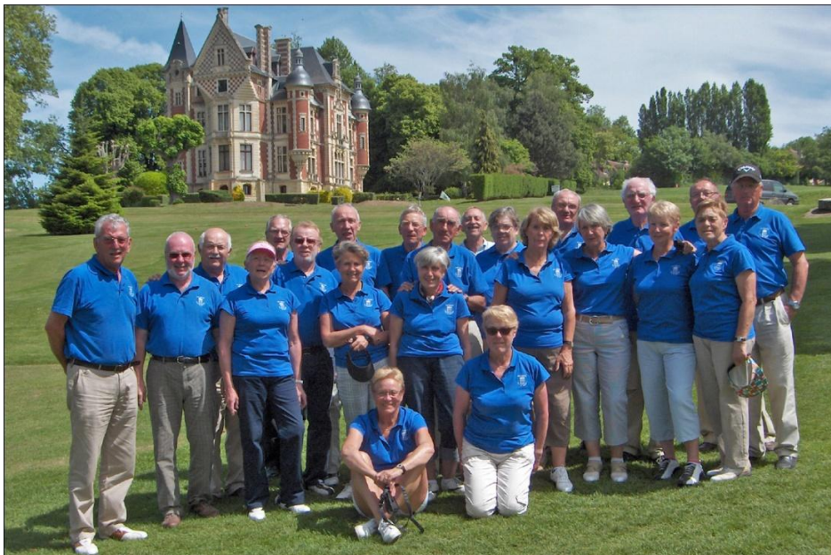
Les amis Seniors devant le château de Beuzeval à Houlgate

Avec la convivialité comme motivation et la compétition pour ambition, notre commission sportive nous avait figolé des formules de jeu adaptées et un scramble à 3 à la ficelle a permis à quelques uns d'entre nous de connaître le « Nirvanà » d'une partie à -9, -8 sous le par. Le 19 e trou cultivé d'un bon appétit et le trou normand respecté, les Amis Seniors sont toujours bien vivants !